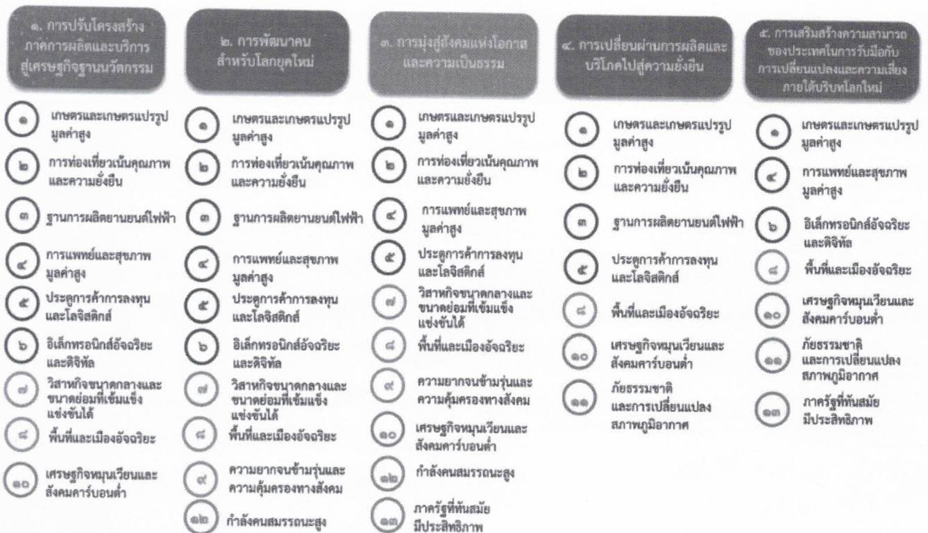
แผนภาพที่ 3.1 ความเชื่อมโยงระหว่างหมวดหมู่การพัฒนาที่เป้าหมายหลัก

ความเชื่อมโยงระหว่างหมวดหมู่การพัฒนาที่เป้าหมายหลักแสดงไว้ในแผนภาพที่ 3.1 โดยหมวดหมู่การพัฒนาที่กำหนดขึ้นเป็นประเด็นที่มีลักษณะเชิงบูรณาการที่ครอบคลุมการพัฒนาตั้งแต่ในระดับต้นน้ำจนถึงปลายน้ำ และสามารถนำไปสู่ผลพัฒนาทั้งในมิติเศรษฐกิจ สังคม ทรัพยากรธรรมชาติและสิ่งแวดล้อมไปพร้อมๆ กัน ทำให้หมวดหมู่แต่ละประการสามารถสนับสนุนเป้าหมายหลักได้มากกว่าหนึ่งข้อ นอกจากนี้การพัฒนาภายใต้แต่ละหมวดหมู่ไม่ได้แยกขาดจากกัน แต่มีการสนับสนุนหรือเอื้อประโยชน์ซึ่งกันและกัน